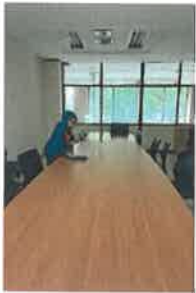
App Image 2024-08-27 at 13.