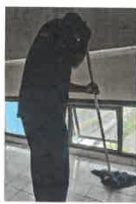
App Image 2024-08-27 at 14.