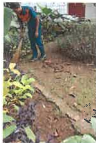
App Image 2024-08-28 at 08.