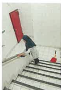
App Image 2024-08-30 at 14.