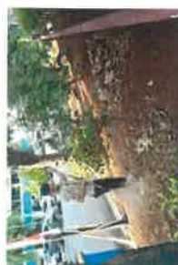
App Image 2024-08-29 at 07.