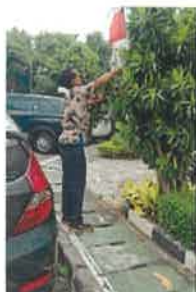
App Image 2024-08-30 at 13.