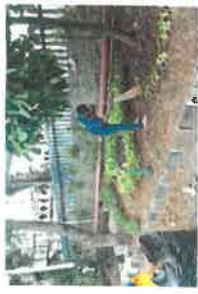
App Image 2024-08-26 at 07.