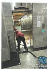
App Image 2024-08-30 at 15.