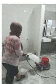
App Image 2024-08-29 at 13.