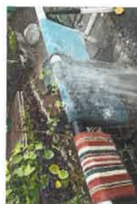
App Image 2024-08-31 at 06.