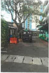
App Image 2024-08-26 at 13.