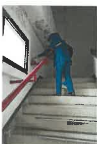
App Image 2024-08-28 at 14.