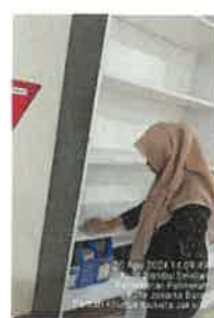
App Image 2024-08-30 at 14.