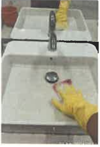
App Image 2024-08-31 at 09.