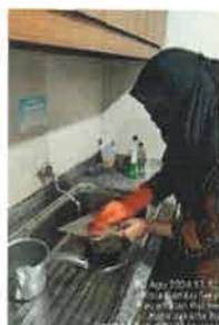
App Image 2024-08-30 at 14.