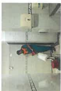
App Image 2024-08-28 at 10.4