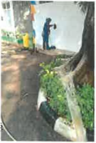
App Image 2024-08-26 at 07.