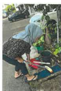
App Image 2024-08-31 at 08.