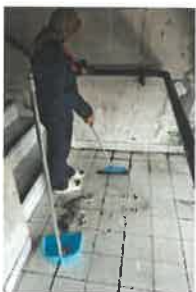
App Image 2024-08-27 at 14.