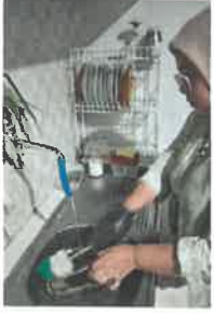
App Image 2024-08-29 at 13.