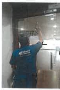
App Image 2024-08-26 at 14.