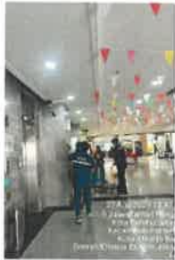
App Image 2024-08-27 at 14.