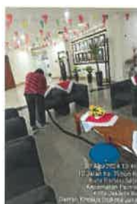
App Image 2024-08-30 at 15.