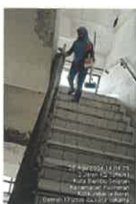
App Image 2024-08-28 at 14.