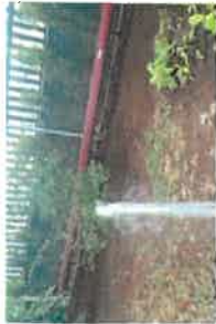
App Image 2024-08-30 at 06.