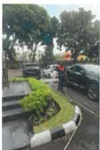
App Image 2024-08-28 at 07.