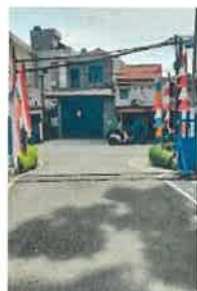
App Image 2024-08-28 at 13.