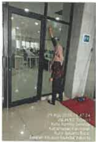
App Image 2024-08-29 at 14.