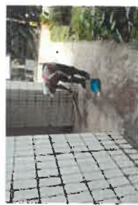
App Image 2024-08-30 at 10.