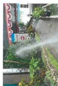
App Image 2024-08-31 at 08.