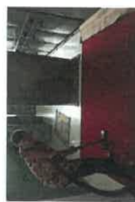
App Image 2024-08-30 at 14.