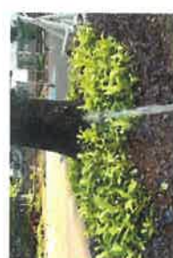
App Image 2024-08-31 at 07.