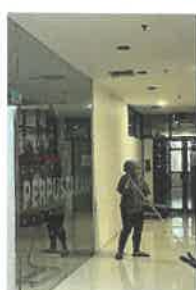
App Image 2024-08-31 at 08.