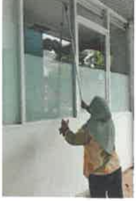
App Image 2024-08-29 at 13.