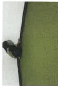
App Image 2024-08-30 at 14.