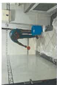
App Image 2024-08-28 at 10.