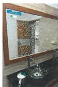
App Image 2024-08-31 at 08.