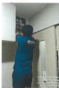
App Image 2024-08-28 at 14.