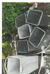
App Image 2024-08-31 at 06.