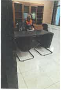
App Image 2024-08-26 at 06.