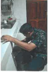
App Image 2024-08-29 at 13.