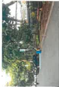
App Image 2024-08-30 at 07.