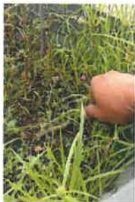
App Image 2024-08-28 at 08.