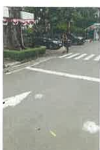
App Image 2024-08-29 at 13.