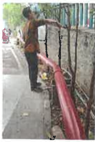
App Image 2024-08-29 at 14.