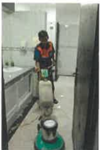
App Image 2024-08-26 at 14.