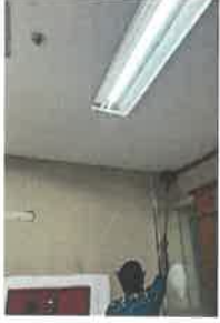
App Image 2024-08-29 at 13.