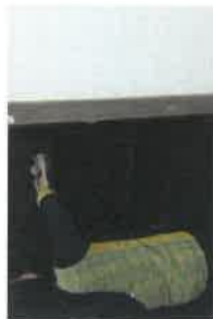
App Image 2024-08-30 at 14.