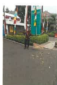
App Image 2024-08-29 at 13.