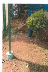
App Image 2024-08-28 at 13.