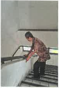
App Image 2024-08-29 at 13.