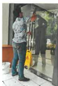
App Image 2024-08-29 at 13.