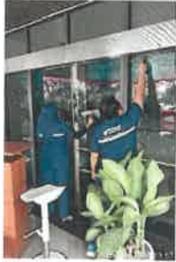
App Image 2024-08-26 at 14.