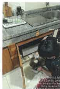
App Image 2024-08-30 at 14.