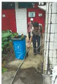
App Image 2024-08-30 at 10.